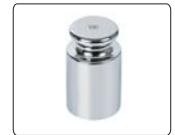
校准砝码 (8305-2000C, 8305-3000C标配)